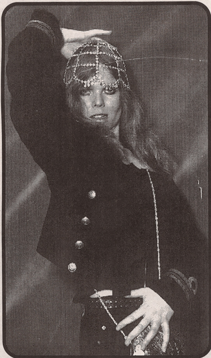
Den umettelige - tar imot det livet har å by henne, og tror ikke på den store kjærligheten. (Foto: Gitte Johannessen/Norpress)

Den motebevisste - også kalt "Miss Gjøvik", med høyt forbruk av moteklær og hårlakk. (Foto: Gitte Johannessen/Norpress)