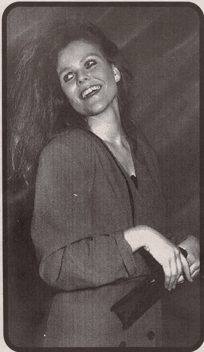
Den motebevisste - også kalt "Miss Gjøvik", med høyt forbruk av moteklær og hårlakk.